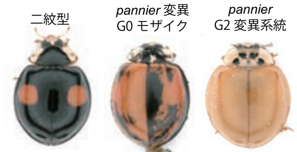
図 2 ナミテントウにおけるゲノム編集技術。CRISPR/Cas9 を利用して pannier 遺伝子の欠損変異を誘導し、処理世代 (G0) 及び次世代 (G2) で斑紋が消失したナミテントウが得られた。

白眉プロジェクトでは、私たちが独自に確立してきたナミテントウにおけるゲノム編集技術（図 2）及び遺伝子組換え技術を駆使することで、特定遺伝子座の染色体断片を自在に操作する技術を確立する。そして、最新の DNA シークエンス技術を駆使して、大規模に DNA 配列を操作した際の染色体のエピゲノム情報と遺伝子発現、表現型との間の因果関係を解明する。以上の解析によって、染色体再編成が新たな表現型を生み出す際の法則を分子レベルで解明することを目指す。さらに、以上の研究で得られた技術・知見を他種生物に応用することで、系統の離れた生物種における平行進化を人為的に再構成し、平行進化が生じる分子基盤の解明にも取り組みたい。